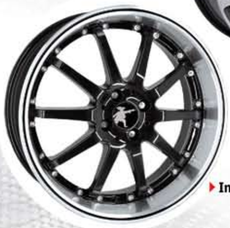
▶ Intergra S 8Jx18

weitere Leichtmetallräder entnehmen Sie unserem Gesamtprospekt oder unserer Homepage www.musketier.com