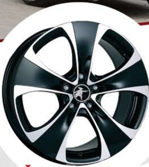
▼ Gallus 8,5Jx18 8,5Jx19