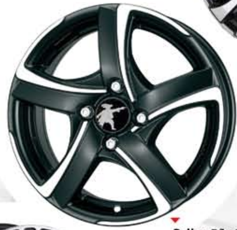
▼ Pallos 7Jx17 8Jx18