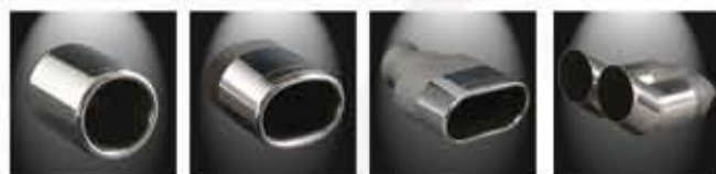
Endrohrvarianten (Beispiele) für Musketier Duplex Sportauspuffanlagen 3008