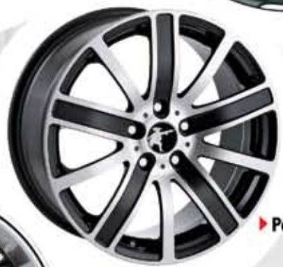
▶ Pegasus 8Jx18 8Jx19