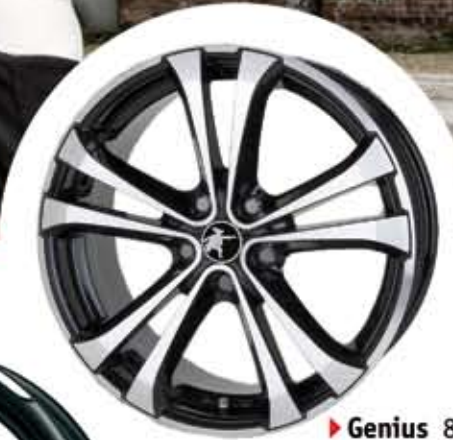
▶ Genius 8Jx18 8Jx19 8,5Jx20