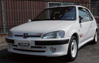
フルレストア1号車

フルレストア1号車の公開以来、多くの反響をいただいている「106 再生計画」。コストを若干抑えた2号車（中古車販売済）、先日ご納車した4号車に引続き、現在は中古車として販売予定の3号車とお客様の5号車の作業が進行中。これまでの膨大な数のチューニング施工やフルレストア施工によるノウハウに加え、多様なルートからパーツを確保。様々なプランをご提案できます。最近では常時2-3台の106が入庫しています。SuperchipsのECU交換やMAXFLOWヘッド加工、ミッション等のOHが車両の延命処置と合わせて人気です。遠方への引取り・納車もご相談ください。YM WORKSでは「106/Saxoに長く乗り続けたい」という方を応援しています。